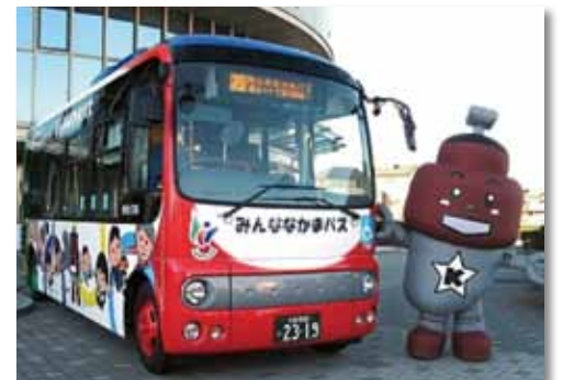
みんななかまバス

平成28年12月から、みんななかまバスの運行経路と時刻の一部が変更されました。対象路線は川口・鳩ヶ谷線、青木線、神根循環、戸塚・安行循環の4路線。なお、新郷循環にあつては、車両2台による社会実験実施路線として指定され、運行便数も1日当たり13便と倍増されています。