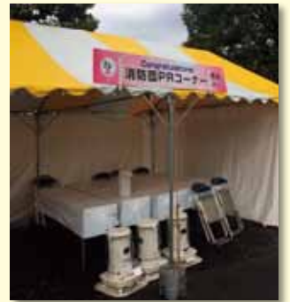
平成29年「はたちの集い」会場に設けられた消防団PRコーナー

(感想) 以前、私が提案した「消防団カレンダー」の作成等も視野に入れ、今後も積極的な団員確保策の展開を期待します。