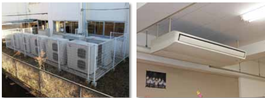
市内中学校に設置されたエアコン室外機・室内機（電気）

校に設置を進めていた、全教室へのエアコン設置が昨年夏前に完了しました。「夏場は、体育の授業や部活が終わってすぐに、勉強する体勢に入ることができ、冬場は、教室内の空気を汚すことなく、スムーズに暖まる。」と子ども達や教員からの評判も上々です。