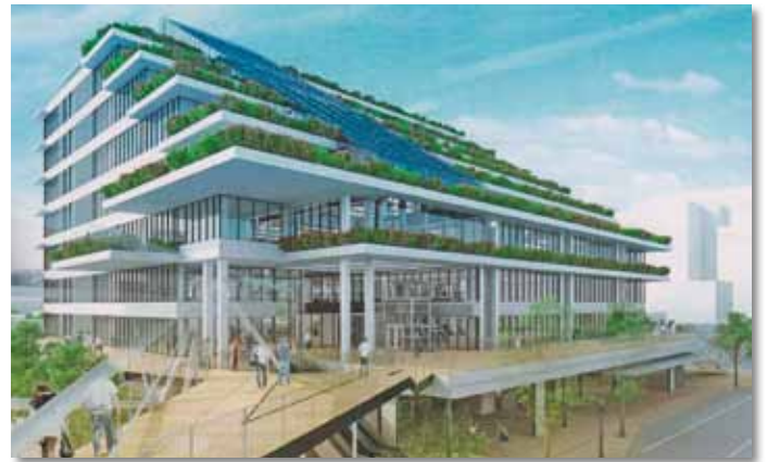
新庁舎1期棟イメージ図

昨年1月に基本設計及び1期棟実施設計等業務委託契約を締結。11月には新庁舎建設に伴う都市計画変更を行いました。平成30年1月の1期棟起工式に向け、現在旧市民会館の解体工事中です。