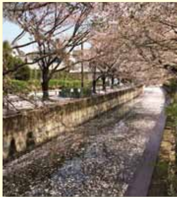
見沼代用水東縁の桜並木

(感想) 関係自治体、さらには民間との協働で、将来的に「世界一」を達成したいものです。