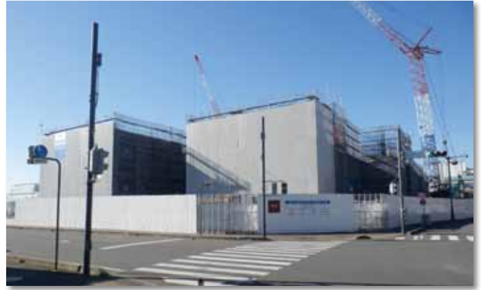
新市立高校建設工事

平成30年4月の開校を目指す「川口市立高等学校」建設工事は、本校舎の3階工事がほぼ終了しました。引き続き4階部分の工事に入っています。