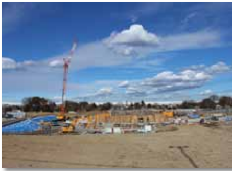
順調に工事が進む火葬施設建設工事

同じく平成30年4月の供用開始を目指す（仮称）赤山歴史自然公園内の（仮称）川口市火葬施設建設工事は、床のコンクリート打設が終わり、地上階の工事に入っています。昨年末には、火葬炉10基の発注も完了しています。