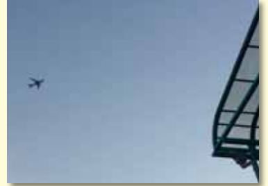
こんな感じ?川口市上空を飛行する航空機

(感想) 今後とも国土交通省、関係自治体等の動向を注視し、市民に対しては積極的な情報提供を行っていくことを要望しました。